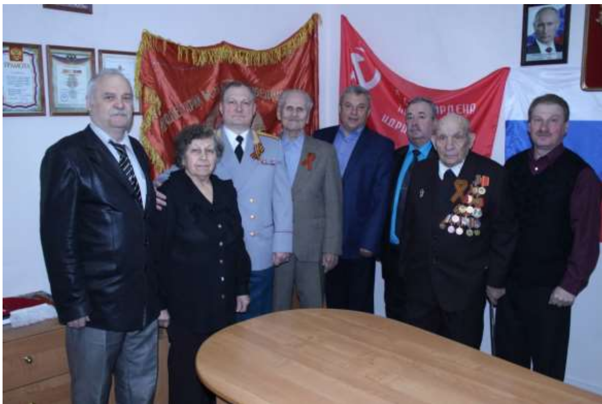
Встреча с ветеранами Великой Отечественной Войны