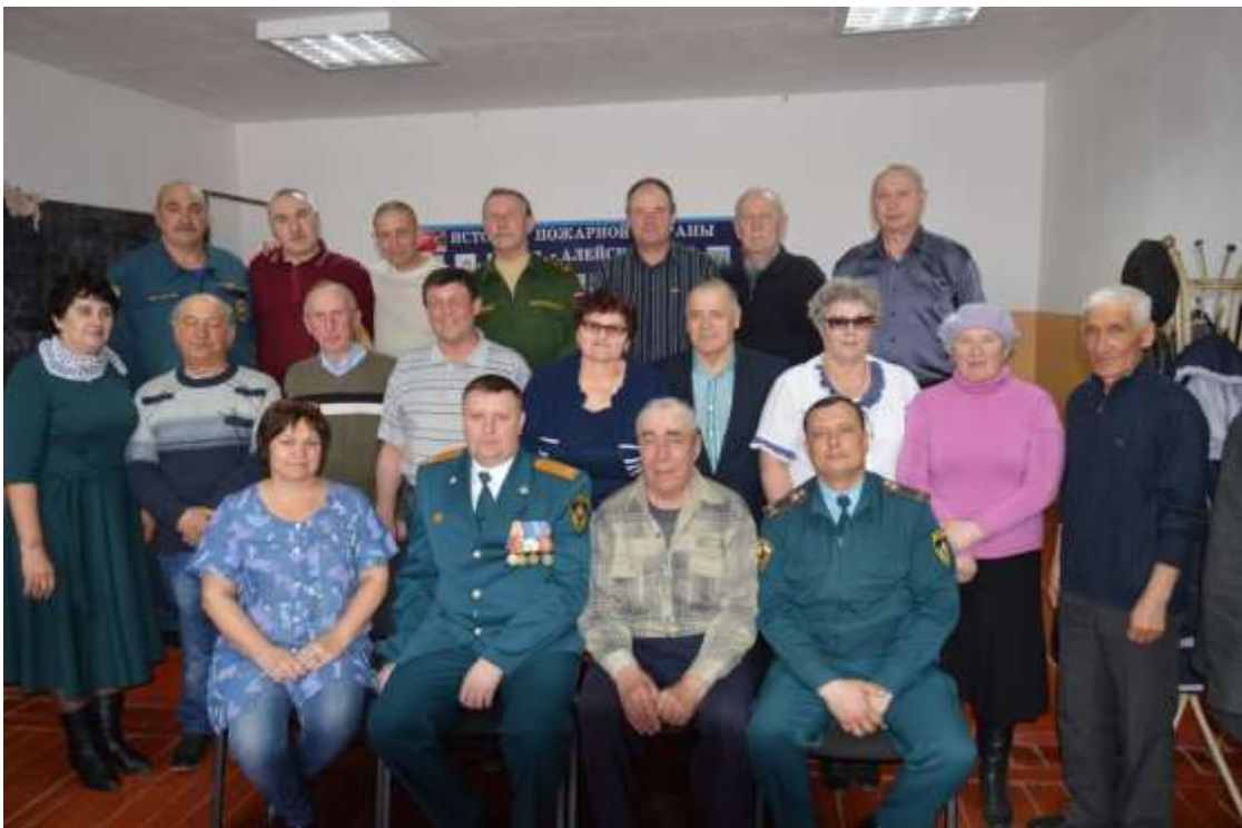
Встреча с ветеранами в подразделениях