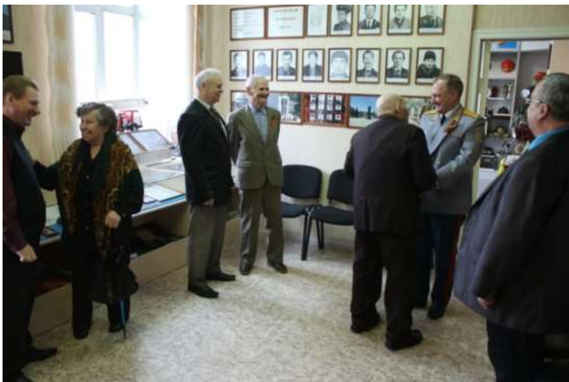
Экскурсия ветеранов в комнату воинской и трудовой славы