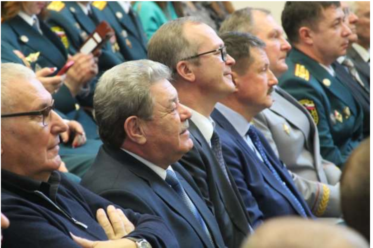
Торжественное мероприятие, посвященное Дню спасателя.