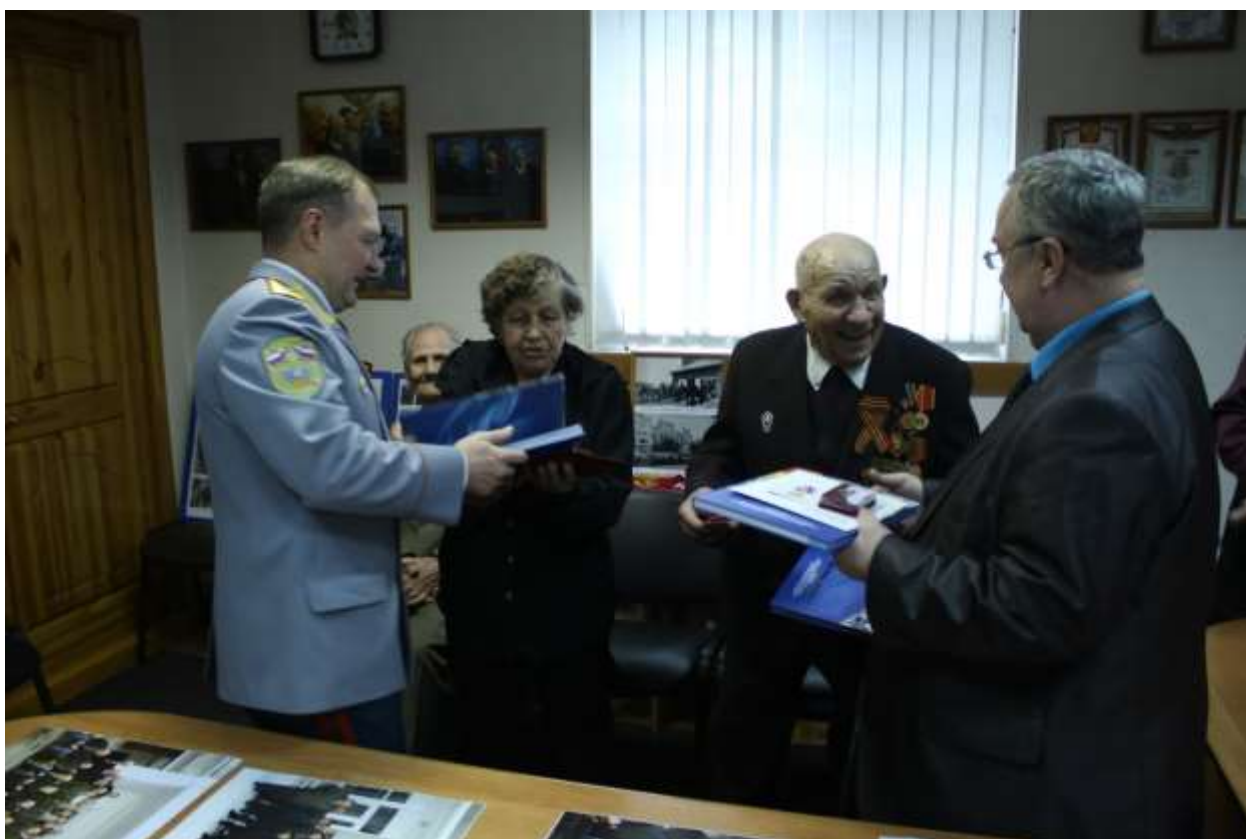
Награждение ветеранов ВОВ в Совете ветеранов