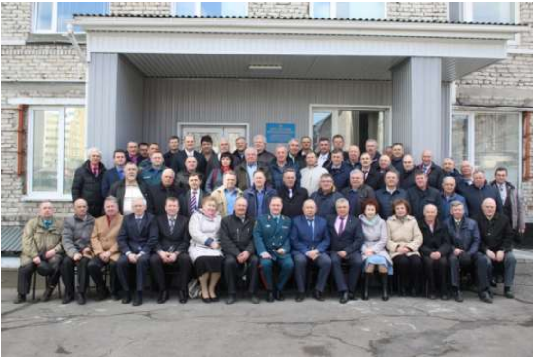
Встреча ветеранов, посвященная 100-летию советской пожарной охраны